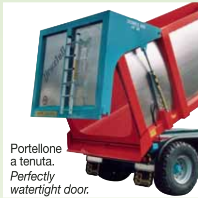
Portellone a tenuta. Perfectly watertight door.