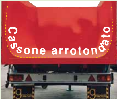
Cassone arrotondato e conico (DOMEX) Conic and round shaped dump (DOMEX)