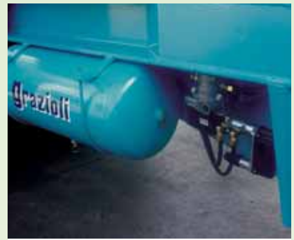
Correttore di frenata Breaking corrector.