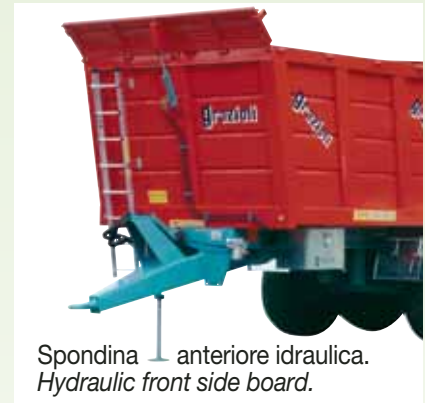
Spondina anteriore idraulica. Hydraulic front side board.

I dati sono indicativi e non impegnativi.