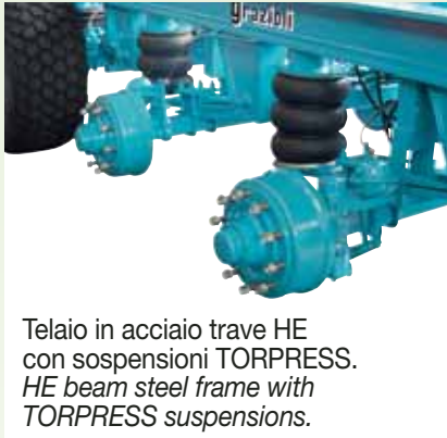
Telaio in acciaio trave HE con sospensioni TORPRESS. HE beam steel frame with TORPRESS suspensions.