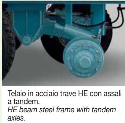
Telaio in acciaio trave HE con assali a tandem. HE beam steel frame with tandem axles.