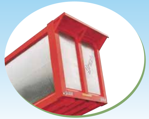
Prolunga per telone. Extension part for tarpaulin.