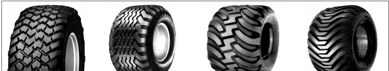
Tipo "N" 500/60 x 22.5 560/60 x 22.5