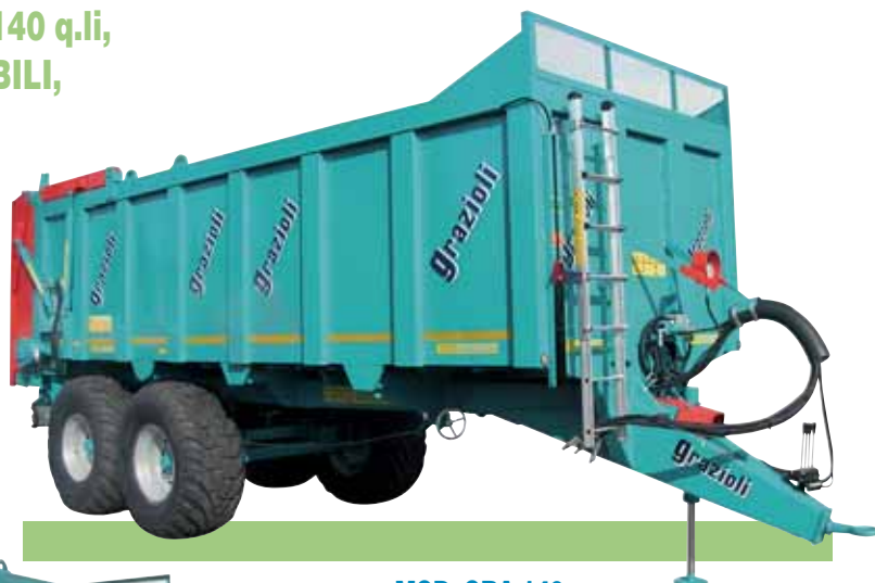
MOD. GRA 140

DI MEDIE E GRANDI PORTATE, DA 60 A 140 q.li, OMOLOGATI, SPONDE FISSE o RIBALTABILI, IN LAMIERA D'ACCIAIO