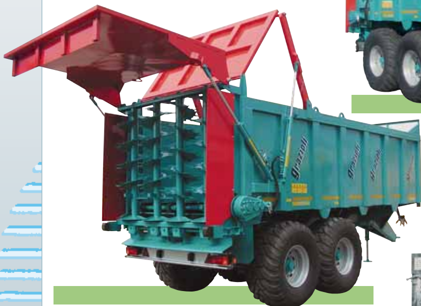
MOD. GRA 140