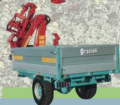
Dati tecnici Serie RMN