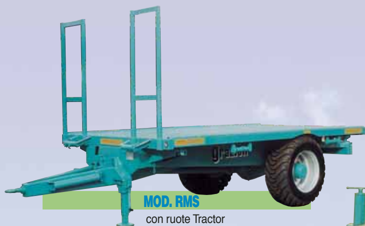
MOD. RMS con ruote Tractor