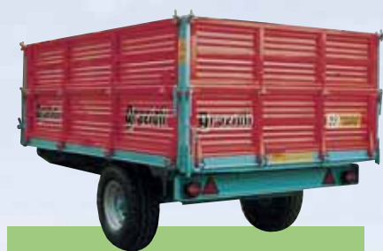
Dati tecnici Serie MF/L