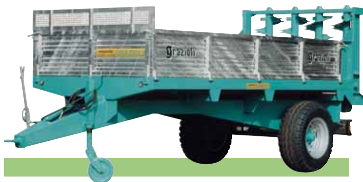
MOD. GRA 50