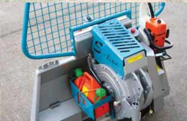
Aufgeräumt und praktisch, die Halter für Kraftstoffkanister und Motorsäge.

Der Seilwindenantrieb erfolgt über ein kräftiges und ruhig laufendes Schnecken- und Stirnradgetriebe. Die Zahnräder laufen im Ölbad, dadurch ist das Getriebe weitgehend wartungs- und verschleißfrei und es gibt keine wartungsintensiven Antriebsketten. Durch den großen Kerndurchmesser beträgt der Zugkraftverlust von der inneren zur äußeren Seillage nur 21 % bei serienmäßiger Seillänge. Pfanzelt verwendet zur exakten Steuerung von Brems- und Kupplungsvorgang Mehrscheiben-Sinterlamellenpakete. Das serienmäßig eingebaute Lastsenkventil, es ermöglicht ein dosiertes öffnen der Bremse, sorgt für zusätzliche Sicherheit bei den täglich anfallenden Arbeiten. Um Störungen bei der hydraulischen Steuerung aus dem Weg zu gehen arbeitet die Pm-Getriebeseilwinde mit einem separaten Ölkreislauf mit Filtereinheit der über eine Hydraulikpumpe gespeist und alle hydraulischen Funktionen bedient.