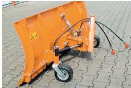
Federklappen Räumschild mit Neigungswinkelverstellung Rake blade with spring flaps with adjustment of the angle of inclination Lame à clapets à ressort avec réglage de l'angle d'inclinaison

Vertically adjustable sliding block kit, vertically adjustable jockey wheels, plastic scraping ribs, warning flags, hydraulic start-up safeguard with a pressure control valve.