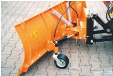
Umklapp Räumschild Folding Rake Blade Lame bull

Höhenverstellbare Gleitschuhgarnitur, höhenverstellbare Stützräder, Kunststoffschürfleisten, Warnflaggen, hydraulische Anfahrssicherung mit Überdruckventil.